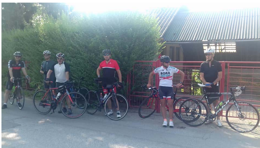
dečki iz Donjeg Vakufa