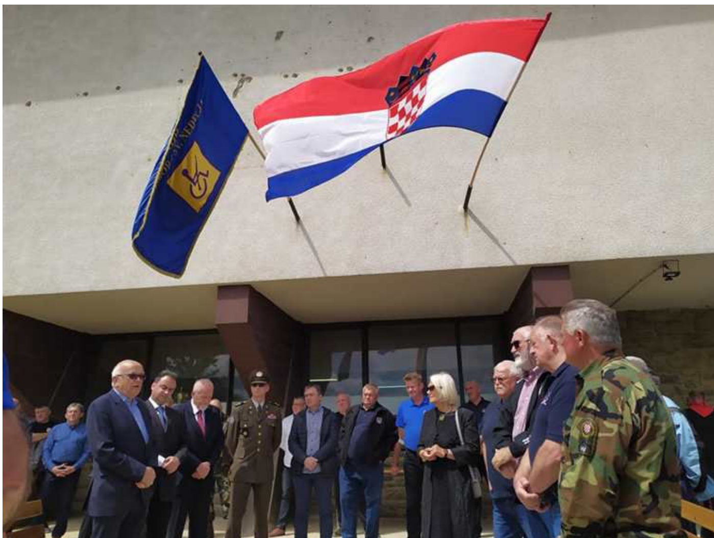
Čestitke je izrazio i zamjenik župana Zagrebačke županije Hrvoje Frankić prigodnim riječima.