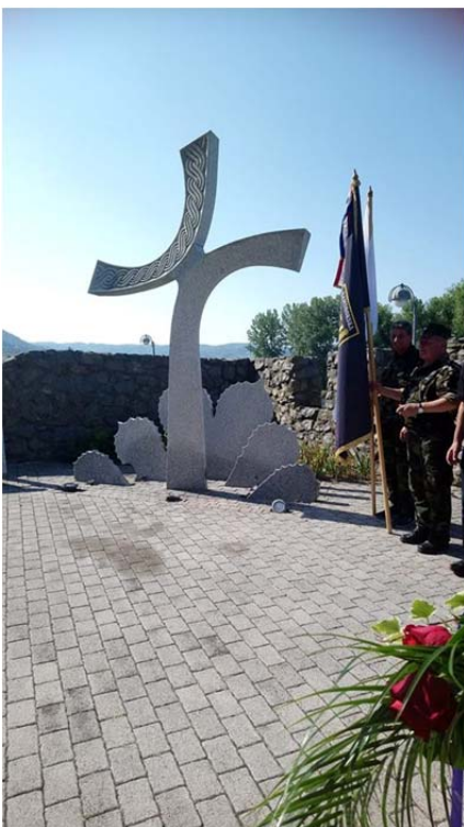
Spomenik Hrvatska Kostajnica