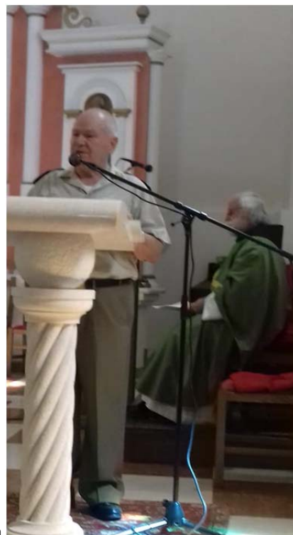
General Rudi Stipčić obratio nam se prigodnim riječima

Pater Stjepan nam je održao Svetu misu u crkvi Sv. Antuna Padovanskog u Hrvatskoj Kostajnici.