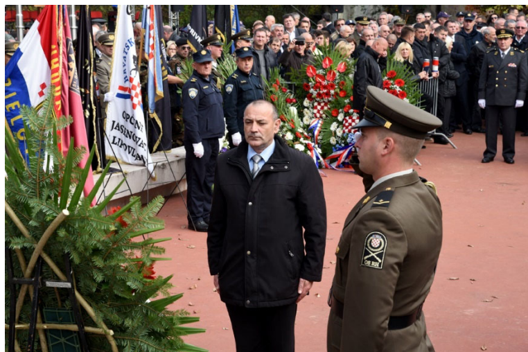
Ministar hrvatskih branitelja general Tomo Medved polaže vijenac