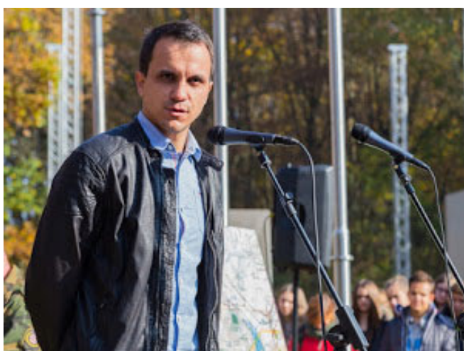
zamjenik gradonačelnika Novske Vedran Mihaljević pozdravio je učenike ispred grada Novske.