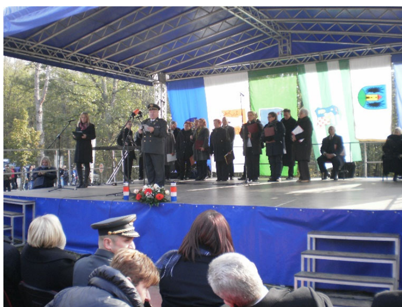
Stećak Ivanić Grad