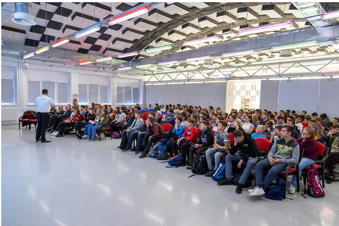
Završetak edukacije 800 učenika proveli smo na tradicionalno na Trokutu 28.10.2018.godine u 2 turnusa: