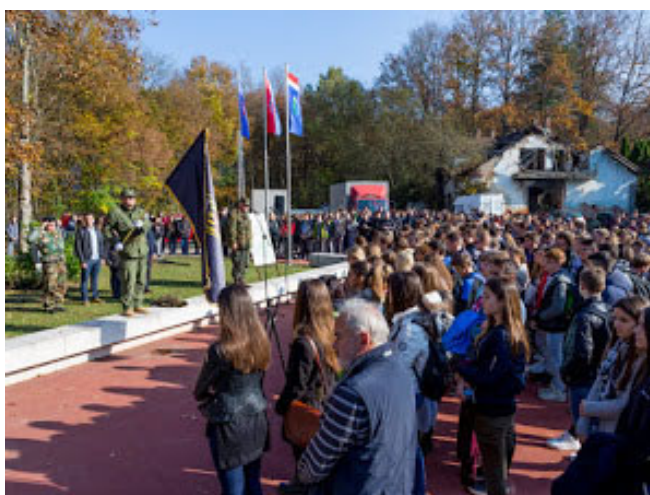
minuta šutnje za poginule svih učesnika