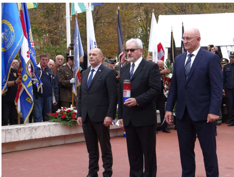
Ministar Tomo Medved polaže vijenac