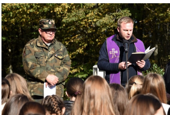
Kapelan iz Samobora održao je molitvu za stradale