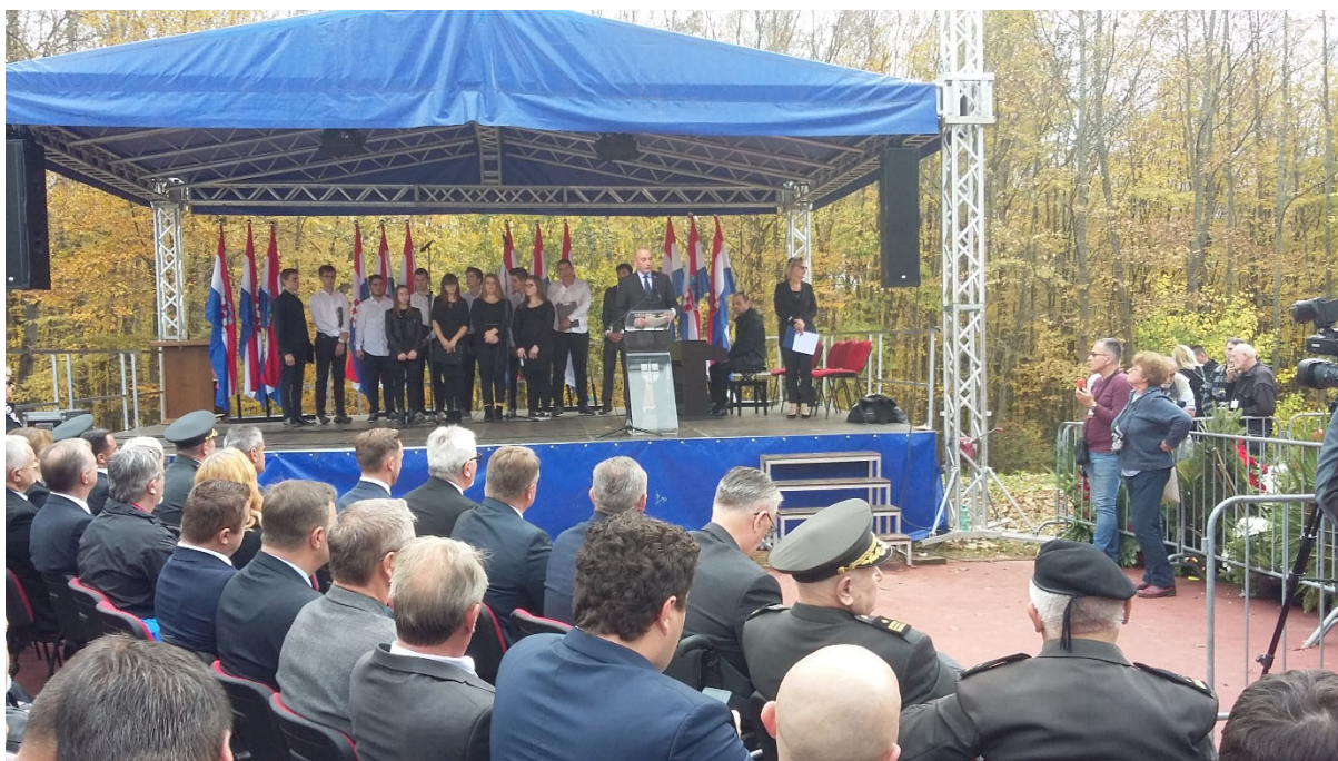
Ministar Tomo Medved obratio se prisutnima prigodnim govorom