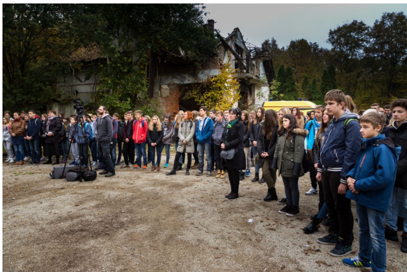
grupa učenika OŠ "B. Toni".