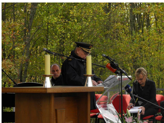
General Rudi Stipčić evocira „ORKAN-91“