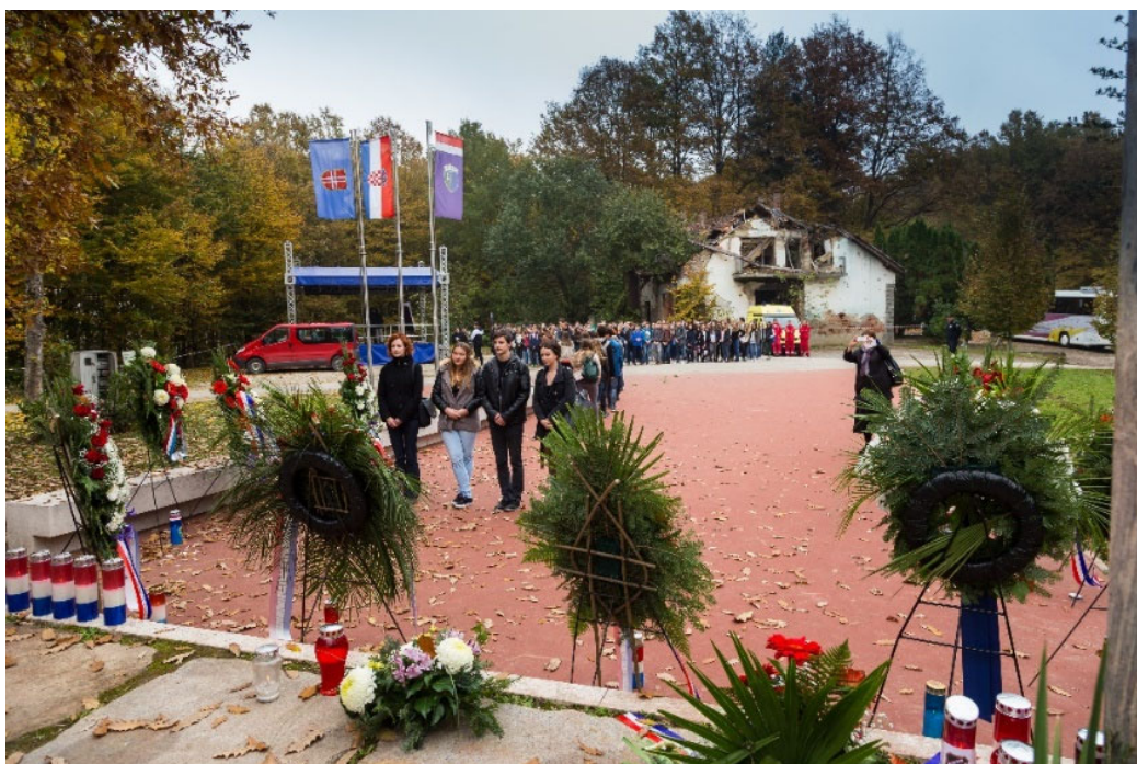
Učenici paljenjem svijeća odaju počast poginulima čija su imena uklesana u spomen stečke 28.10.2015.g.