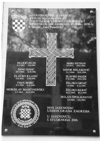
Ploča s natpisom "Za dom spremni" kod Novske ima 24-satnu policijsku zaštitu?