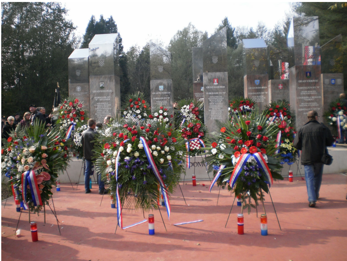
Devet stećaka 2014.godine.

U dvorani srednje školskog centra na temu Domovinski rat u rujnu 2015.započeli smo edukaciju školske djece osmih razreda osnovnih, te prvih razreda srednjih škola: